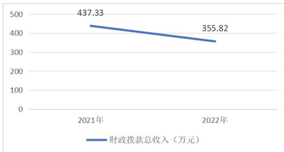
图 4: 财政拨款收、支决算总计变动情况

2022 年度财政拨款收入中,一般公共预算财政拨款收入 355.82 万元,比 2021 年度决算数减少 82.05 万元。减少主要原因一是工资福利支出较上年减少,二是压缩一般性支出,项目支出较上年减少。