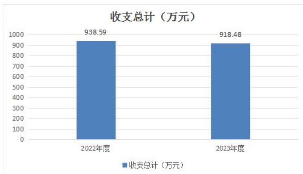
图1：收、支决算总计变动情况

2023年度收、支总计918.48万元。与2022年度相比，收、支总计各减少20.11万元，下降2.14%。主要变动原因为突发公共卫生事件应急处理方面相关支出减少，增加融媒体中心建设项目，以及单位新增职工。