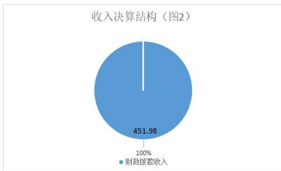
图 2：收入决算结构（单位：万元）