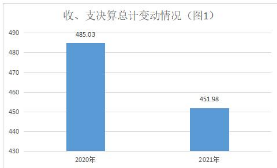
图 1：收、支决算总计变动情况（单位：万元）

2021 年度收、支总计 451.98 万元。与 2020 年度相比，收、支总计各下降 33.05 万元，下降 6.8%，主要原因主要原因是政策性人员经费减少，压减了部分项目支出。