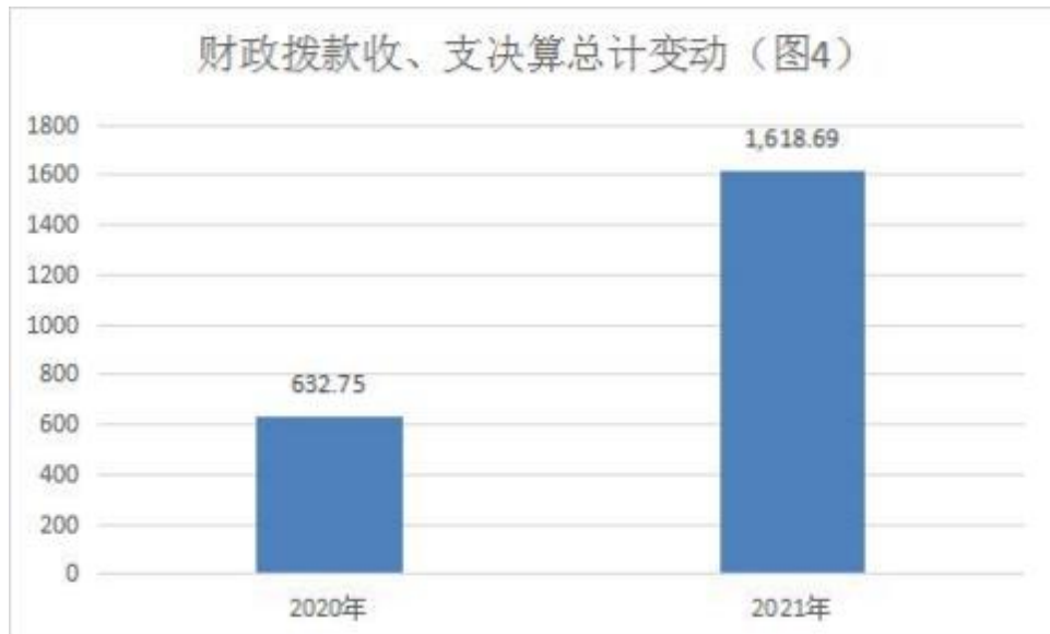
图 4：财政拨款收、支决算总计变动情况（单位：万元）

2021 年度财政拨款收、支总计 1,618.69 万元。与 2020 年度相比，财政拨款收、支总计各增加 985.94 万元，增长 155.8%。主要原因是国有资本经营预算项目支出增加，增加国有企业退休人员社会化管理补助支出。