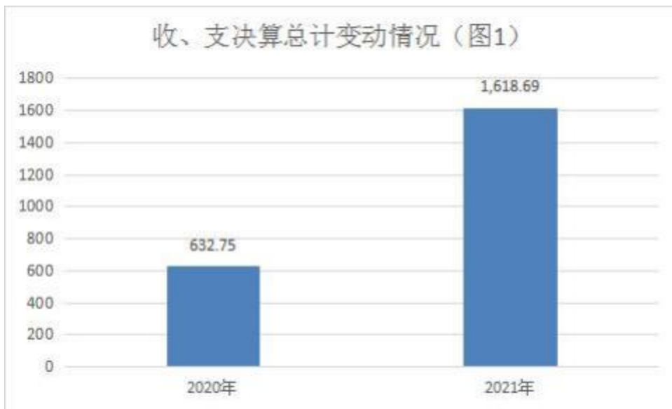
图 1：收、支决算总计变动情况(单位：万元)

2021 年度收、支总计 1,618.69 万元。与 2020 年度相比，收、支总计各增加 985.94 万元，增长 155.8%，主要原因是国有资本经营预算项目支出增加，增加国有企业退休人员社会化管理补助支出。