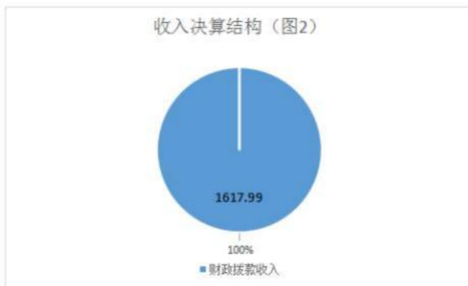
图 2：收入决算结构（单位：万元）