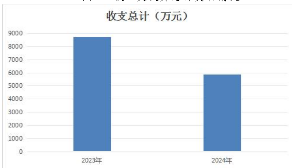
图 1: 收、支决算总计变动情况