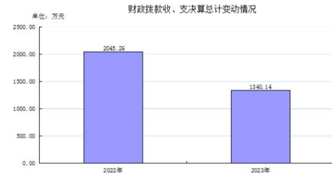
图4：财政拨款收、支决算总计变动情况

2023 年度财政拨款收入中，一般公共预算财政拨款收入1,340.14万元，比 2022 年度决算数减少705.12 万元。减少主要原因是上年初区财政向我局一次性拨付区拆迁遗留项目周转金800万元，用于进一步做好全区拆迁遗留项目社会稳定工作。上年末，该拆迁遗留项目周转金已全部转入区土地储备中心实行专户管理，金额及用途无变化。