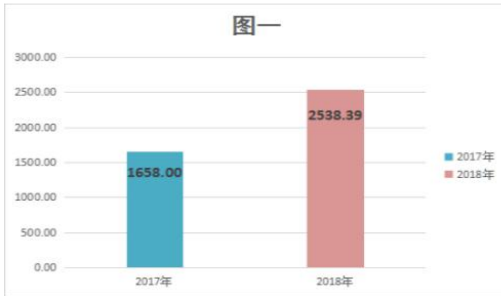
图 1：收、支决算总计变动情况 单位：万元

2018 年度收、支总计 2,538.39 万元。与 2017 年相比，收、支总计各增加 880.39 万元，增长 53.10%，主要原因是江汉区监察委新成立，同时各项预算增加，支出相应增加。