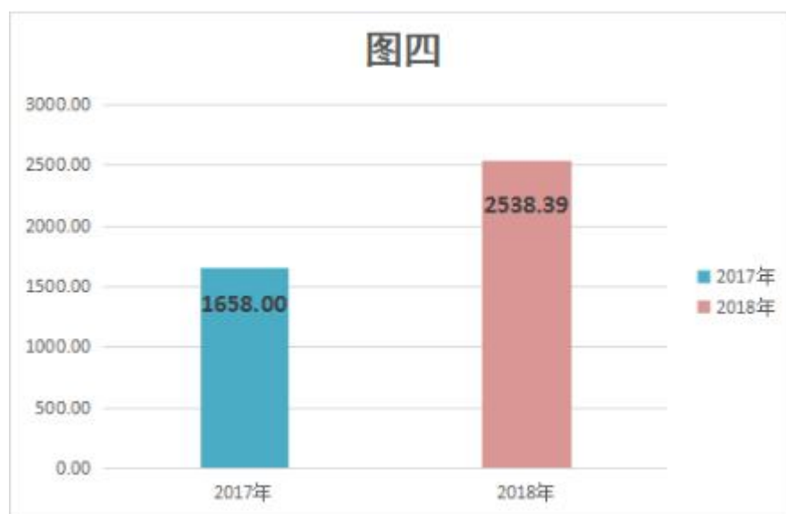
图 4：财政拨款收、支决算总计变动情况 单位：万元

2018 年度财政拨款收、支总计 2,538.39 万元。与 2017 年相比，财政拨款收、支总计各增加 880.39 万元，增长 53.10%。主要原因是江汉区监察委新成立，同时各项预算增加，支出相应增加。