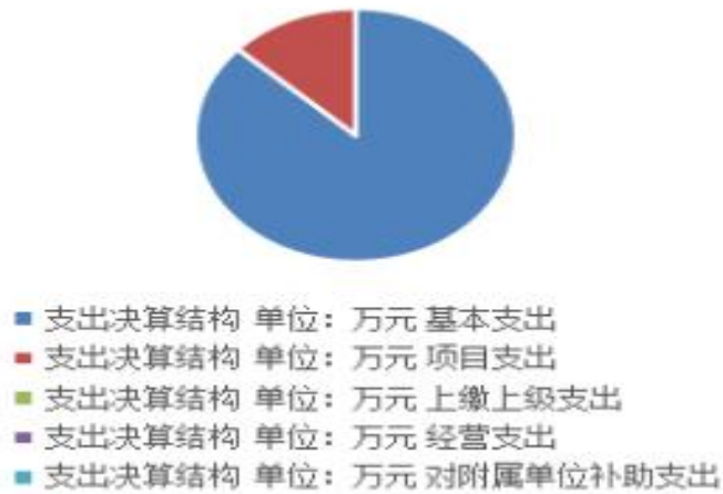
支出决算结构 单位：万元