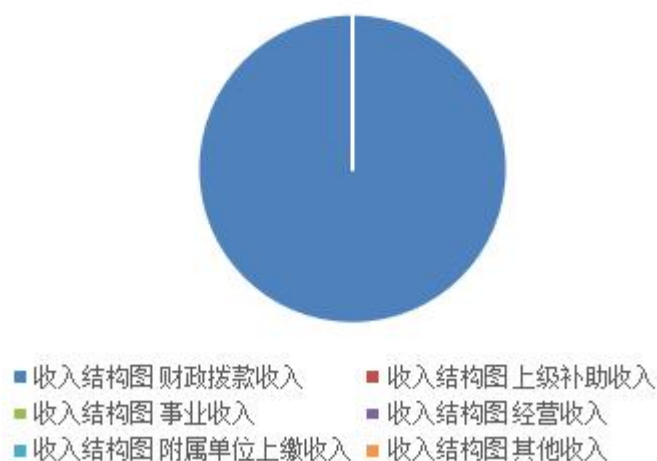
收入决算结构图 单位：万元