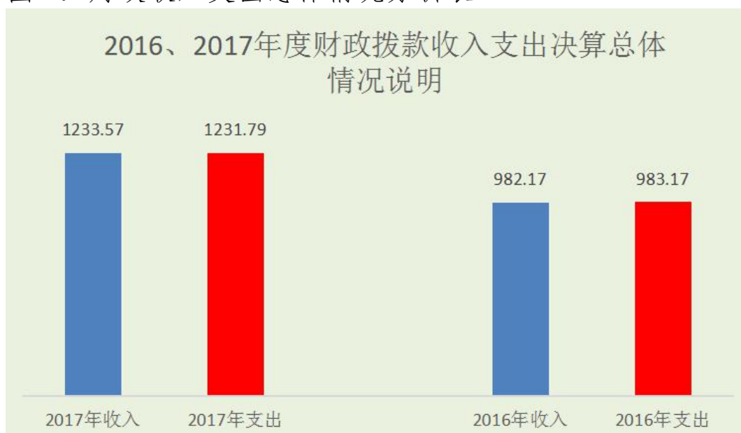
图 4：财政收入支出总体情况分析表

2017 年度财政拨款收入总计 1233.57 万元。与 2016 年相比，财政拨款收入总计增加 251.4 万元，增长 25.5%。2017 年度财政拨款支出总计 1231.79 万元。与 2016 年相比，财政拨款支出总计增加 248.62 万元，整长 25.2%。主要原因是 2017 年增加了退休人员 16、17 年医疗补助、在职人员 10-15 年职工住房补贴、在职及离退休人员基本工资及津贴和退休人员养老金调整。