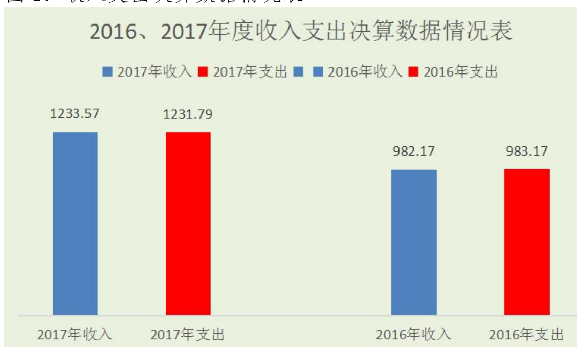
图 1：收入支出决算数据情况表

2017 年度收入总计 1233.57 万元。与 2016 年相比，收入总计增加 251.4 万元，增长 25.5%。2017 年度支出总计 1231.79 万元。与 2016 年相比，支出总计增加 248.62 万元，增长 25.2%。主要原因是 2017 年增加了退休人员 16、17 年医疗补助、在职人员 10-15 年职工住房补贴、在职及离退休人员基本工资及津贴和退休人员养老金调整。