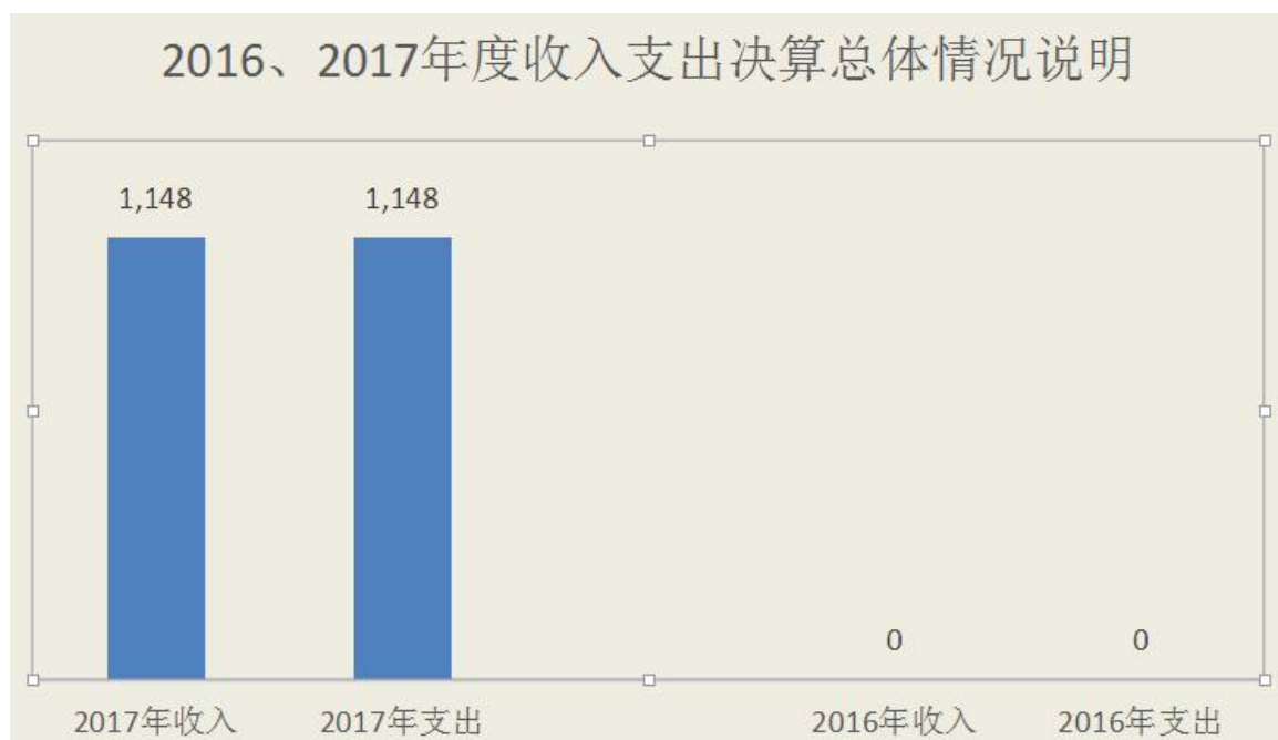
图 1：收支决算总体情况

2017 年度收、支总计 1,148 万元。与 2016 年相比，收、支总计各增加(减少)1,148 万元，增长(降低)0%，主要原因是本单位属于 2017 年新纳入财政预算单位。